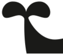
Lichterloh - Ein Funke in der Luft (Band 2)